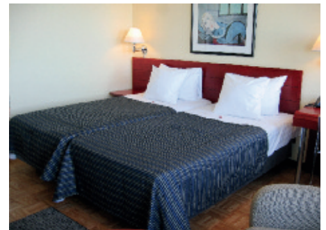
Sokos Hotel Viru

Die estnische Hauptstadt Tallinn liegt nur ca. 70 km von Helsinki auf der südlichen Seite des finnischen Meerbusens und wird von verschiedenen Reedereien angefahren. Die Altstadt Tallinns mit ihren romantischen Gässchen, historischen Gebäuden und kleinen Handwerker-Boutiquen lädt für einen Bummel ein! Auch ein Kurztrip (morgens hin/abends zurück) ist möglich, doch lernen Sie die Stadt besser kennen, wenn Sie sich dort etwas länger aufhalten. Gerne stellen wir Ihnen das gewünschte Programm zusammen.